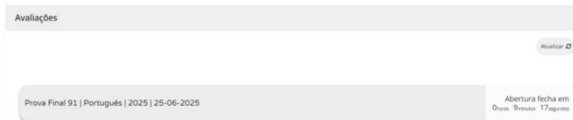
Figura 2 – Acesso à prova a realizar

11.11. Nas provas, ao clicar em “Iniciar sessão”, por exemplo, para um aluno que realiza a prova final de Português (91), aparece o seguinte ecrã: