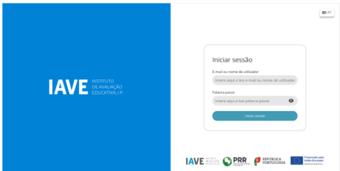
Figura 1 – Acesso à Plataforma de Realização de Provas do IAVE

c) Inserir as credenciais “Nome de utilizador” e “Palavra-passe” e, em seguida, clicar em “Aceder” ou “Iniciar sessão”.