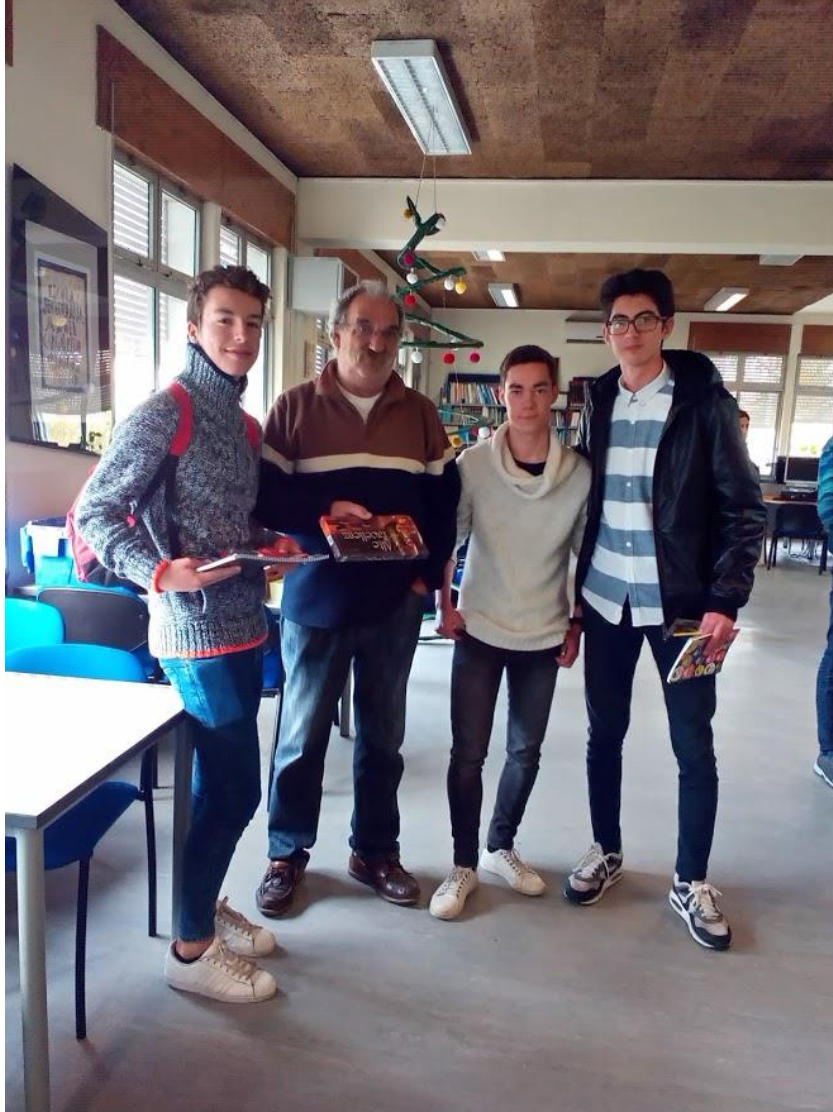
Os três premiados